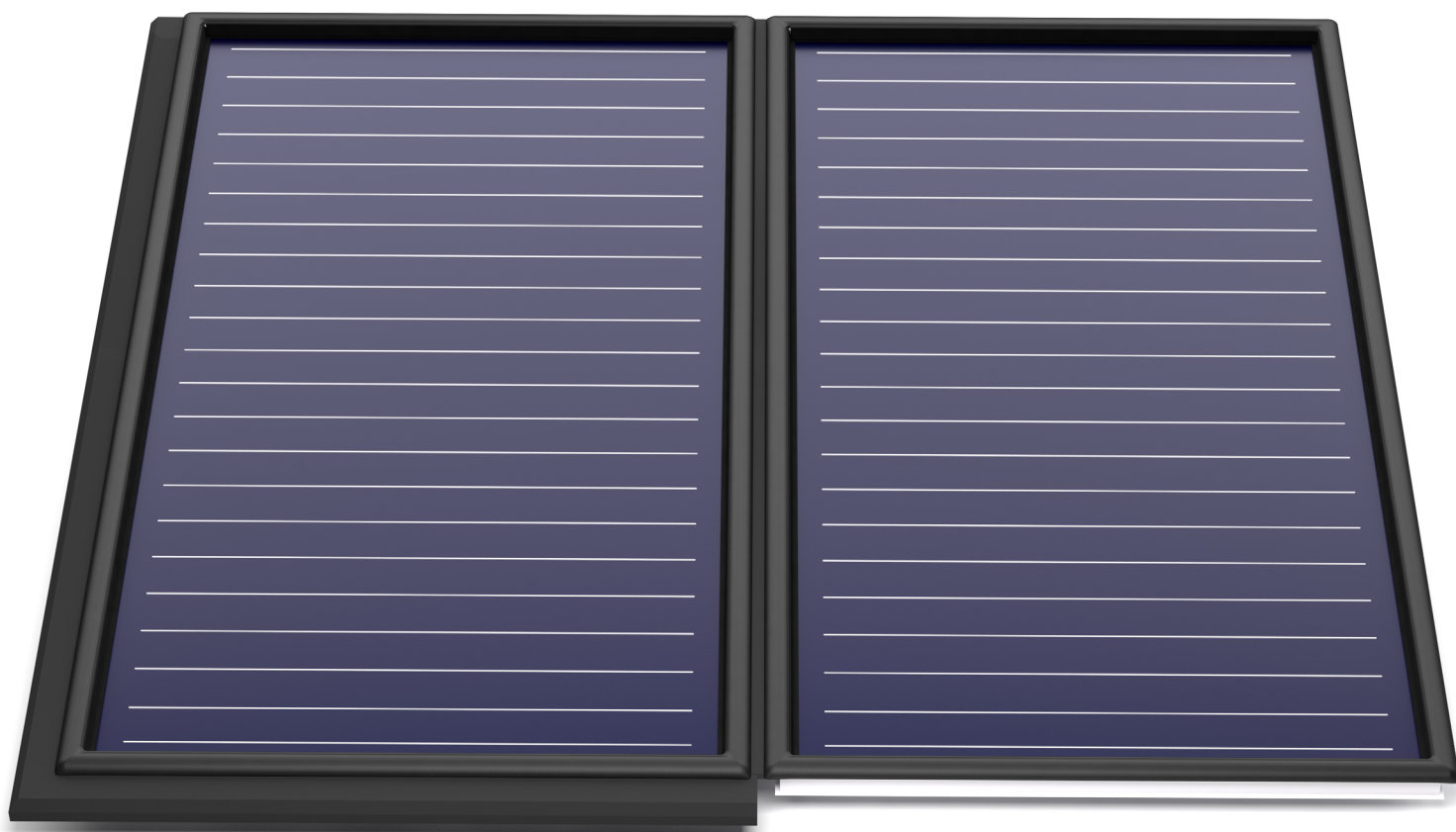
KOLLEKTOR MIT SNAPCOVER COLLECTOR WITH SNAPCOVER